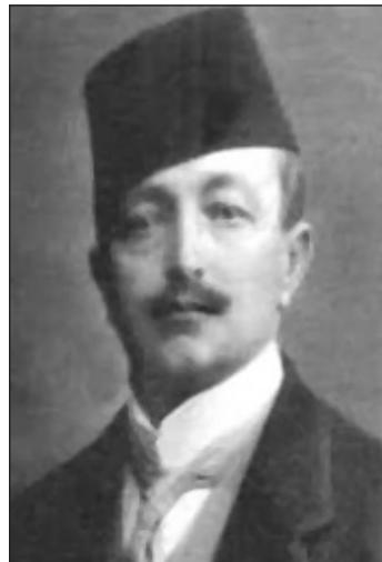
Prilog 1. Bakir-beg Tuzlić.

Ifaket-hanumu 26 i Šemsa-hanumu. 27 Bakir-beg je u političkom životu Bošnjaka krajem 19. i početkom 20. stoljeća igrao značajnu ulogu, pulsirajući od proaustro-ugarske, ka antiaustro-ugarskoj naklonjenosti. Odnosno, svoje političko djelovanje je usklađivao svojim interesima i potrebama. Neki historijski izvori ukazuju da je saradivao sa Srpskim pokretom za crkveno-školsku autonomiju, te posebno da je još od 1892. godine bio blizak sa Jeftanovićem. 28 Dok drugi potvrđuju “da je otvoreno Vladi nudio svoje usluge i pružao obavještenja o prilikama u muslimanskom pokretu i raspoloženju među njegovim prvacima. Pri tome je posebnog značaja imala okolnost, što je on nastavio da uživa finansijsku potporu vlasti”. 29 Bio je aktivni sudionik u svim važnim političkim procesima, pa tako i borbi za vjersko-mearifsku i vakufsku autonomiju Bošnjaka. 30 Već 1898. godine Bakir-beg se pojavljuje kao potpisnik predstave posavskih begova (begova brčanskog i bijeljinskog kotara) u kojoj se izražava nezadovoljstvo položajem begova, čija su prava, kako su isticali, zaštićena manje nego prava čifčija-kmetova. 31