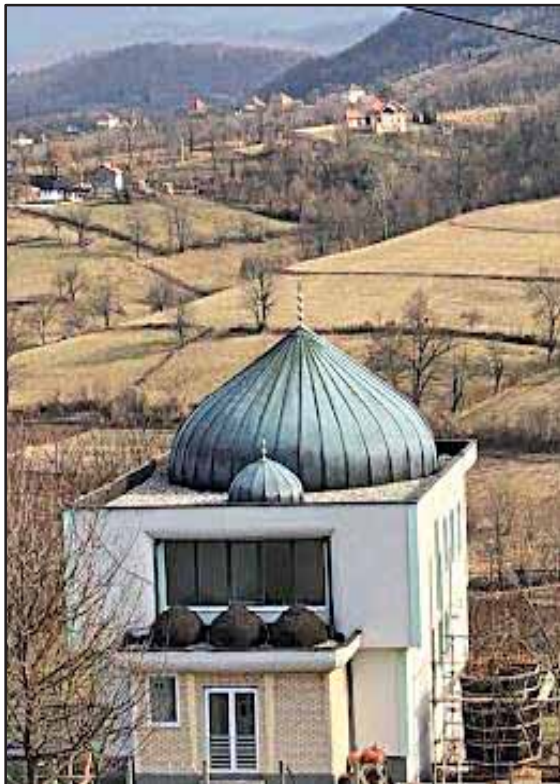
Prilog 5. Novi mekteb-mesdžid u Gojčinu uz koji je započeta izgradnja munare, s njegove desne strane. 50