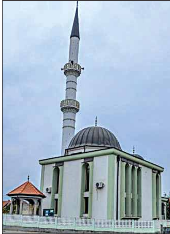
Prilog 4. Nova džamija u Jelovom Brdu svečano otvorena 3. 8. 2008. godine. 49

Kako autor Monografije ne navodi izvor za navedeni podatak, 47 teško je izvršiti provjeru njegove autentičnosti te ostaje nejasno da li se radi o istom vjerskom objektu tretiranom u ovome radu, a koji se nalazio u Pandurima, ili se radi o mektebu u Gojčinu koji je do temelja porušen u Agresiji na Bosnu i Hercegovinu (1992-1995). 48 Međutim, pouzdano znamo da danas u Jelovom Brdu postoji moderno dizajnirana potkupalna džamija sa zidanom munarom s jednom zatvorenom i dvije otvorene šerefefe, a u Gojčinu potkupalni mesdžid zanimljive arhitektonske izvedbe, s projektiranom munarom s njegove desne strane.