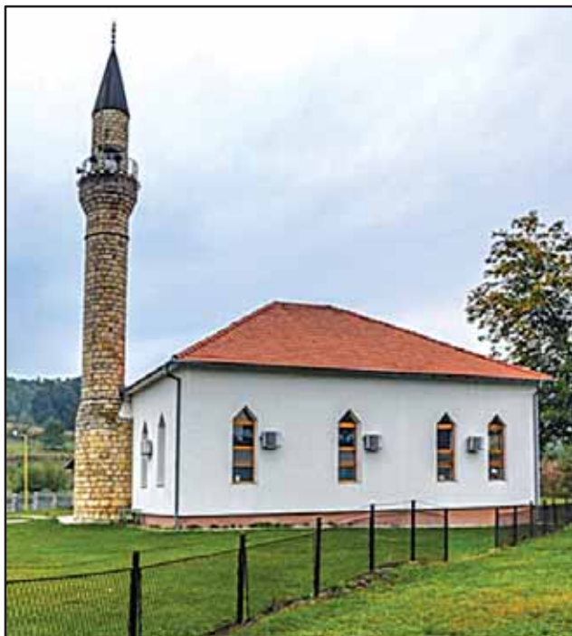
Prilog 3. Sadašnja obnovljena i rekonstrisana džamija. Iz priloženih fotografija se vidi da je uz džamiju zadržana stara zidana munara, s jednom otvorenom šerefom. 40