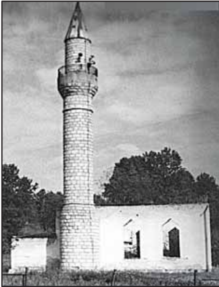
Prilog 2. Stara džamija u Kalesiji Gornjoj devastirana u Agresiji na Bosnu i Hercegovinu (1992-1995).

Prva džamija [u Kalesiji] iz doba osmanlijske uprave Bosnom sagrađena je od drveta sa drvenom munarom. Nije stradala u dva svjetska rata. Zbog njene dotrajalosti, mještani su 1966. godine sagrađili, sa četvorovodnim krovom, novu džamiju od čvrstog materijala, a munara je ozidana od kamena. 37