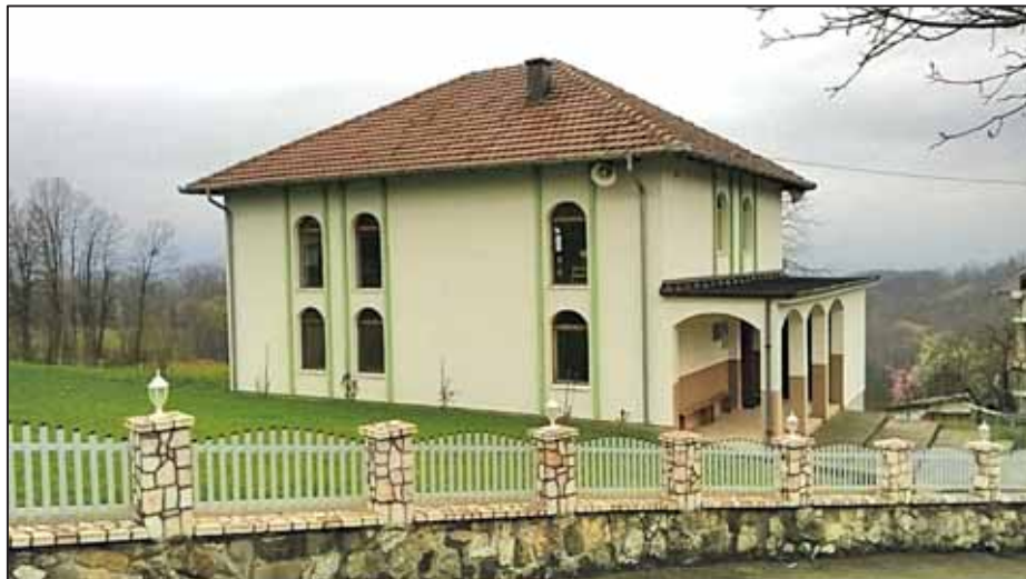
Prilog 6. Današnji izgled mesdžida u selu Mahmutovići kod Kalesije. 53

Prema narativnim saznanjima, u vrijeme pred Agresiju na Bosnu i Hercegovinu (1992-1995), sve vjerske aktivnosti u Mahmutovićima obavljale su se u jednoj privatnoj kući, koja je kupljena, odnosno zamijenjena za adekvatnu vakufsku parcelu. Kako je navedena kuća u Agresiji potpuno uništena, odmah po završetku Agresije mještani su pristupili izgradnji mesdžida na novoj lokaciji. Već 2002. godine mesdžid je bio u funkcionalnom stanju, a završni radovi na fasadnom i dvorišnom uređenju objekta okončani su 2014. godine. 54