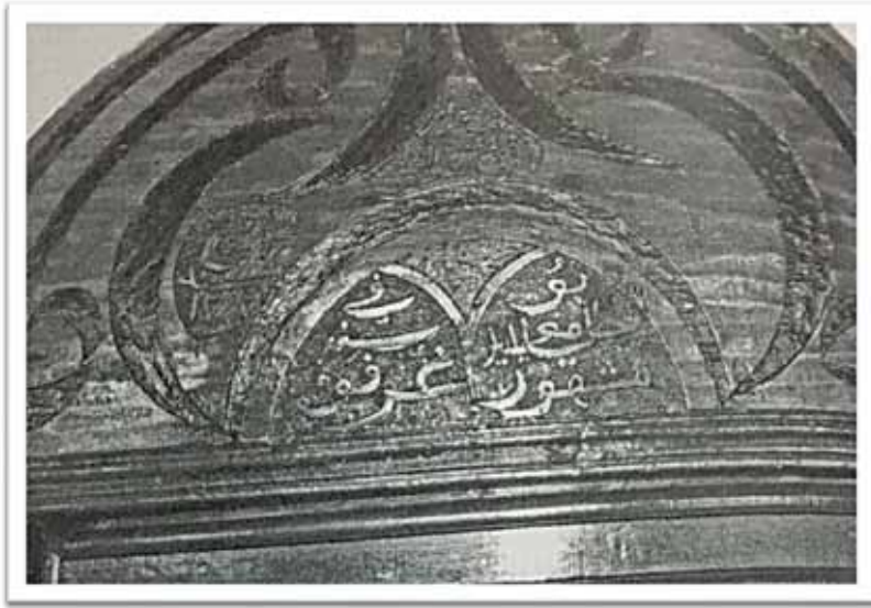
Prilog 2. Natpis iznad ulaznih vrata Stare Carske džamije u Plavu.

su skoro dva vijeka činili jedine muslimanske stanovnike ovih krajeva. Najvjerojatnije je bila izgrađena kao džamija za potrebe vojske. 45