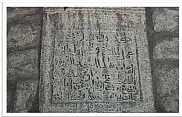
Prilog 4. Tarih iznad ulaznih vrata Šabovića džamije.

Šabovića džamija . Džamiju je kao vakuf izgradio jedan od uglednijih plavskih trgovaca, Haso Ferović, 1880. godine. 51 Izgrađena je od kamena a minaret od drveta. Spada u tip džamija sa četvorovodnim krovom. Dobila je naziv Šabovića, zato što je najveći dio imama u njoj bio iz ove porodice. 52