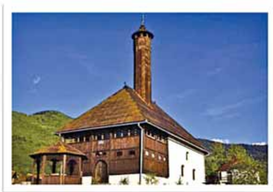
Prilog 1. Stara Carska džamija u Plavu.

Brojni podaci ukazuju da ova džamija više od vijek ipa nije služila lokalnom stanovništvu, već potrebama vojnika i nosilaca osmanske vlasti koji