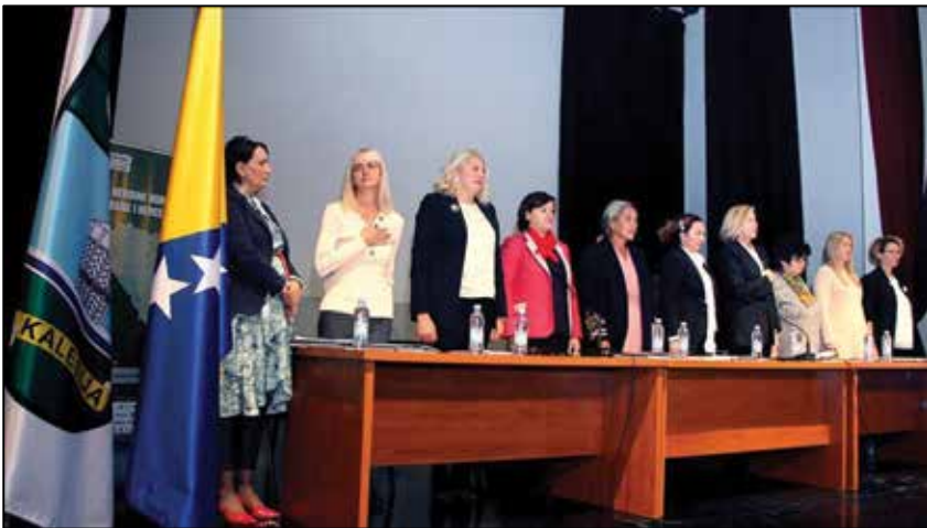
Prilog 2. Učesnice okruglog stola „Heroine odbrane Bosne i Hercegovine.“