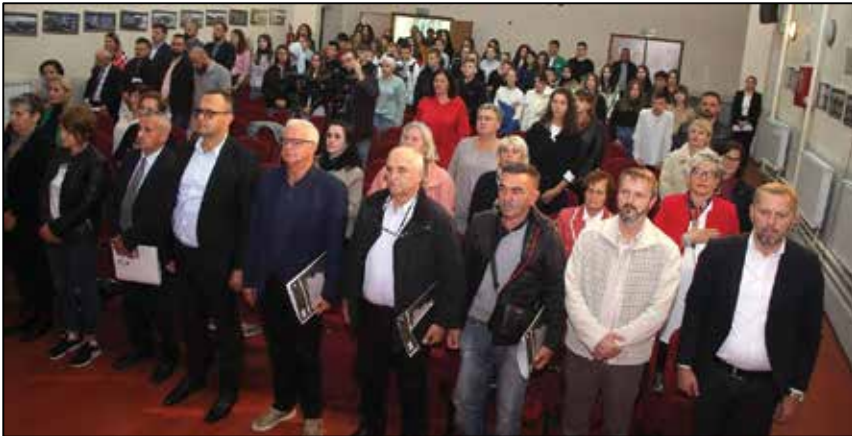
Prilog 3. Detalji sa okruglog stola „Heroine odbrane Bosne i Hercegovine.

njima. Uloga i pozicija pripadnica ARBiH u izvršenoj agresiji i odbrambenooslobodilačkoj borbi nedovoljno je istražena, elaborirana i verificirana, kako smo to i danas iz prezentiranih izlaganja mogli zaključiti. To više ne smije biti tako, posebno imajući u vidu značaj i ulogu koju žena ima u porodici, kao temeljnoj ćeliji društva, iz koje slijedi i pozicija žene u društvenoj zbilji. Položaj braniteljki, kao i članova njihovih porodica, u društvenoj zbilji sadašnjice degradirajući je, ponižavajući, nedostojan i nehuman. Dobar dio odgovornosti snose same braniteljke koje su, iako su u najtežim trenucima odsudne odbrane bile spremne ispoljiti svoju hrabrost i odlučnost, u momentima postkonfliktnog oporavka države i društva, zanemarile svoju poziciju i nisu pokazale dovoljno spremnosti da se za nju izборе. Stoga je neophodno, poboljšati socijalno-statusni položaj braniteljki propisivanjem posebnih socijalno-statusnih prava onima koje nisu morale – nisu bile vojne obveznice, ali JESU dale značajan doprinos u odbrani domovine.