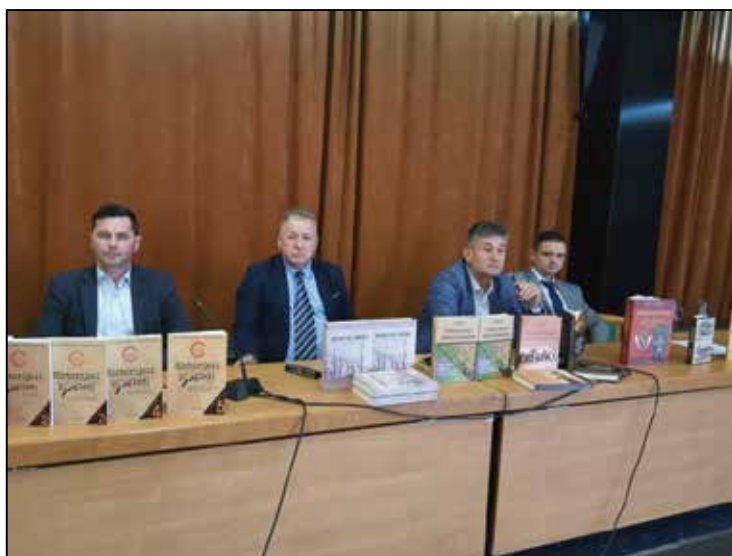
Prilog 7. Promocija izdanja CIMOSHIS-a Tuzla na Petom HISTORY FESTU, Sarajevo, 12. juni 2021.