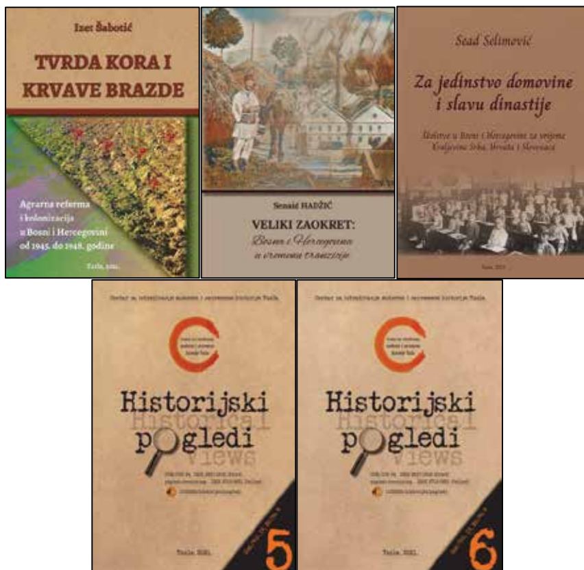
Prilog 3. Izdanja CIMOSHIS-a Tuzla u 2021. godini..

Potrebno je istaći da je Izdavač Centar za istraživanje moderne i savremene historije Tuzla, donio odluku da se publikuju dva broja časopisa „Historijski pogledi“ u toku godine.