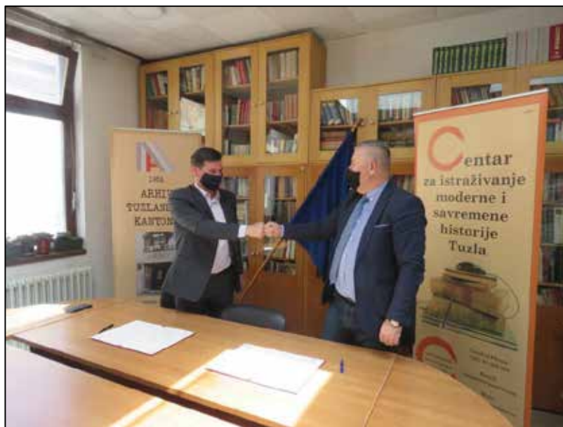
Prilog 9. Potpisivanje sporazma o saradnji iz oblasti nauke i kulture između Arhiva TK i CIMOSHIS Tuzla.

Dana 04. 05. 2021. godine, u prostorijama Arhiva Tuzlanskog kantona potpisan je Sporazum o saradnji iz oblasti nauke i kulture između Centra za istraživanje moderne i savremene historije Tuzla i JU Arhiv Tuzlanskog kantona.