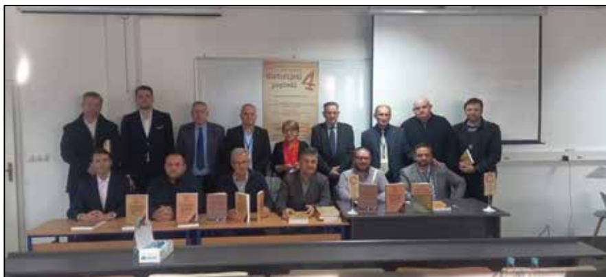
Prilog 2. Učesnici Naučne manifestacije „Historijski pogledi 4“.

Utjecaj Drugog svjetskog rata po Bosnu i Hercegovinu, predstavlja na neki način dodatno educiranje i podizanje svijesti kod mladih historičara, pa i studenata o važnosti i značaju njihovih utjecaja, ciljeva i pretenzija na Bosnu i Hercegovinu. Naučna konferencija treba da bude podstrek svim budućim historičarima, da kontinuirano prate i održavaju naučne skupove iz historije Bosne i Hercegovine, osobito iz oblasti političkih, društvenih, privrednih, kulturnih i prosvjetnih prilika procesa i utjecaja Drugog svjetskog rata na iste, odnosno na uzroke i posljedice Drugog svjetskog rata po Bosnu i Hercegovinu. Naučna konferencija treba da podstakne na razmjenu iskustava sa naučnicima iz drugih susjednih zemalja o historijskim procesima u Bosni i Hercegovini, da tragaju i istražuju nove historijske činjenice o tih događajima koji su obilježili historiju Bosne i Hercegovine.