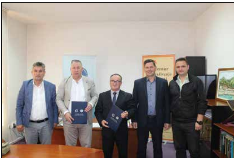
Prilog 10. Potpisivanje sporazma o saradnji iz oblasti nauke i kulture između Instituta za društvena i religijska istraživanja i CIMOSHIS Tuzla.

Dana 14. 06. 2021. godine, u prostorijama Instituta za društvena i religijska istraživanja Tuzla potpisan je Sporazum o saradnji iz oblasti nauke i kulture između Centra za istraživanje moderne i savremene historije Tuzla i Instituta za društvena i religijska istraživanja Tuzla.