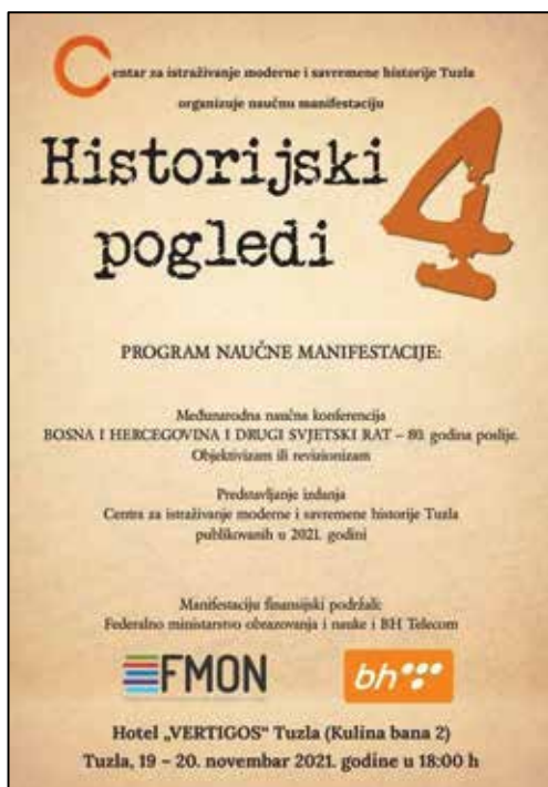
Prilog 1. Plakat Naučne manifestacije „Historijski pogledi 4“.

ciljem podsjećanja na uzroke i posljedice Drugog svjetskog rata po Bosnu i Hercegovinu, obnovu njene državnosti (zasijedanja ZAVNOBiH-a), te istraživanju Drugog svjetskog rata, sa pozicije objektivizma ili revizionizma.