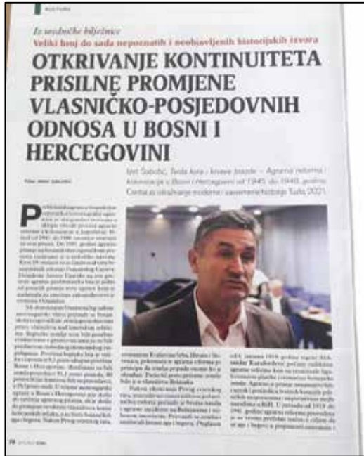
Prilog 4. O knjizi Tvrda kora i krvave brazde , „Stav“, 2021.

Također, potrebno je istaći časopis „Historijski pogledi“ indeksiran je u tridesetosam (38) međunarodnih baza: SCOPUS; C.E.E.O.L - Central and Eastern European Online Library; ERIH PLUS - European Reference Index for the Humanities and Social Science; DOAJ - Directory of Open Access Journals; Crossref – DOI; HeinOnline; MIAR – Information Matrix for the Analysis of Journals; ROAD - Directory of Open Access scholarly Resources; ICI - Index Copernicus International; EuroPub – Directory of Academic and Scientific Journals; ESJI - Eurasian Scientific Journal Index; SIS - Scientific Indexing Services; Slavic Humanities Index with full text; ISI- International Scientific Indexing; ASI- Advanced Sciences Index; ResearchBib – Academic Resource Index; CiteFactor – Academic Scientific Journals; DRJI - Directory of Research Journals Indexing; OAJI - Open Academic Journals Index; Google Scholar - Bibliographic database; Electronic Journals Library of University of Regensburg; OCLC - Online Computer Library Center – WorldCat; BASE - Bielefeld Academic Search Engine; Academia.edu; ResearchGate.net; OpenAIRE; GIF - General Impact Factor; Semantic Scholar; ScienceGate: Academic Search Engine; Microsoft Academic Search; JISC Sherpa Romeo; Dimensions Digital Science; Scilit - Scientific Literature; OUCI - Open Ukrainian Citation Index, Ulrichs Periodicals Directory - Bibliographic database; Researcher.Life – Global Journal database; Scite_ database; KindCongress – World With Science. 7