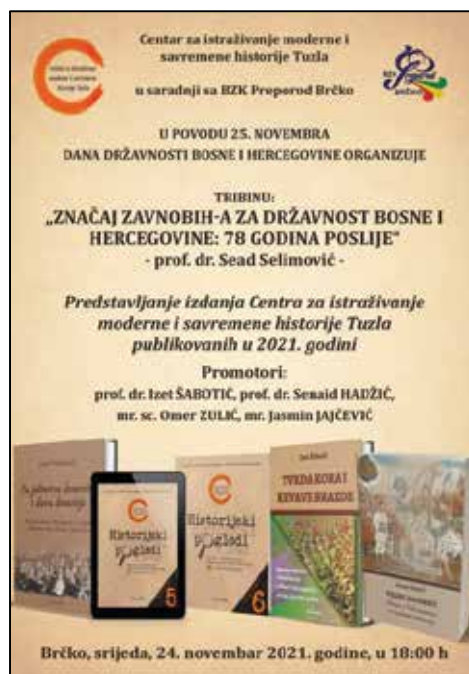
Prilog 8. Promocija izdanja CIMOSHIS-a Tuzla u Brčkom, 24. novembra 2021.