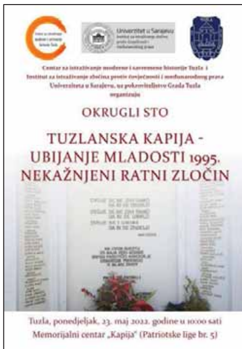
Prilog 6. Plakat okruglog stola, održanog 23.5.2022. godine.

Na okruglom stolu istaknuto je da stradanje tuzlanske mladosti zaslužuje daleko veću naučnu pažnju koja je do sada izostala, kao i da svjedočimo negiranju zločina na Kapiji, ali i neprocesuiranju odgovornih. Negiranja dolaze od izvršioca, planera, od onih koji su kumovali tom događaju i koji čine sve da ga izbrišu iz našeg pamćenja. Rezultat toga su ne samo medijski istupi koji bole, nego i članci, pa i knjige koje su namjenski i sistemski rađene, a podržane su od najviših institucija u Srbiji. Neprocesuiranje odgovornih za zločin vodi nezadovoljenju pravde, a negiranje je ponovno diranje