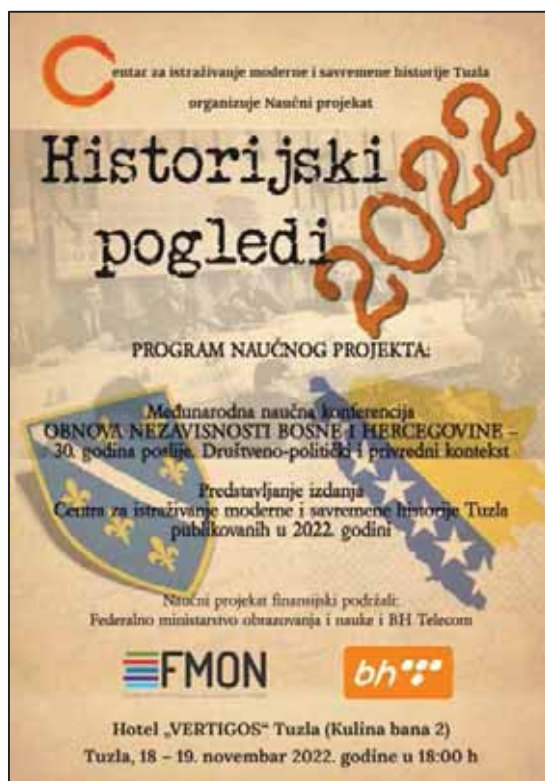
Prilog 1. Plakat Naučnog projekta „Historijski pogledi 2022“.

Rat i agresija na Bosnu i Hercegovinu okončana je Okvirnim sporazumom za mir u Bosni i Hercegovini, poznatijim kao Dejtonski mirovni sporazum. Dejtonskim mirovnim sporazumom Bosna i Hercegovina je ustrojena kao država tri konstitutivna naroda i ostalih njenih građana, te dva entiteta- Federacije Bosne i Hercegovine i Republike Srpske. Proces provođenja aneksa Dejtonskog sporazuma odvijao se sa brojnim poteškoćama i destrukcijama od strane snaga koje su težile Bosnu i Hercegovinu prikazati nefunkcionalnom i neodrživom državom. Opstruiran je povratak prognanih lica u svoja prijeratna mjesta, obnova zemlje, rad državnih ustanova i svi drugi procesi koji bi Bosnu i