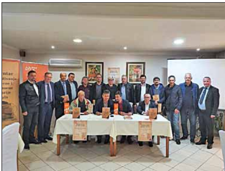
Prilog 7. Promocija časopisa „Historijski pogledi“, god. IV, br. 6, Tuzla, 7.4.2022. godine.

U organizaciji Centra za istraživanja moderne i savremene historije Tuzla održana je promociju časopisa “Historijski pogledi”, god. IV, br. 6, Tuzla 2021. Promocija je održana u Hotelu “Minero-Rudar” Tuzla (ul. Mitra Trifunovića Uče 9). Četvrtak, 7. april 2022. godine u 16:30 h