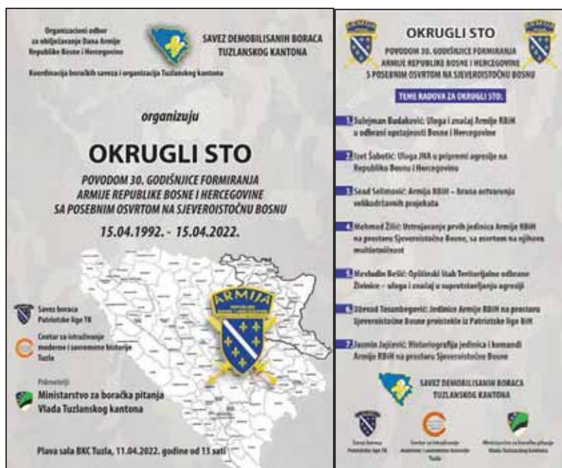
Prilog 4. Plakat i program okruglog stola, održanog 11.4.2022. godine.

Okrugli sto povodom 30. godišnjice formiranja Armije Republike Bosne i Hercegovine sa posebnim osvrtom na sjeveroistočnu Bosnu (15.4.1992 - 15.4.2022). održan je 11. 04. 2022. godine u 13. sati u BKC Tuzla.