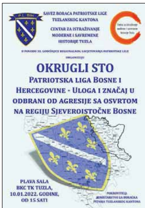
Prilog 3. Plakat okruglog stola, održanog 10.1.2022. godine.