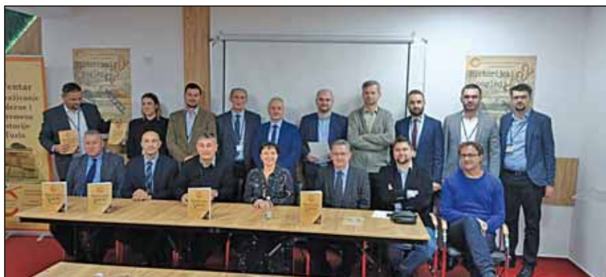
Prilog 2. Učesnici Naučnog projekta „Historijski pogledi 2022“.

Obnova nezavisnosti i period agresije Bosnu i Hercegovinu, predstvalja na neki način dodatno educiranje i podizanje svijesti kod mladih historičara, pa i studenata o važnosti i značaju njihovih utjecaja, ciljeva i pretenzija na Bosnu i Hercegovinu. Naučna konferencija treba da bude podstrek svim budućim