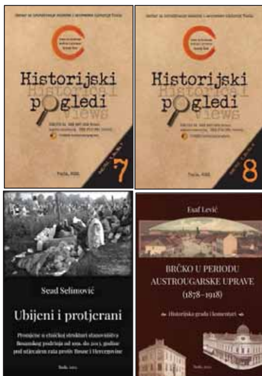
Prilog 11. Publikacije štampane u izdanju CIMOSHIS Tuzla u 2022. eodini.

U okvirima izdavačke djelatnosti u 2022. godini, CIMOSHIS je publikovao slijedeće publikacije: