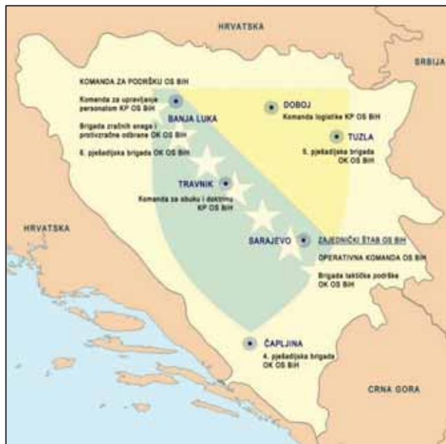
Prilog 2. Razmjestaj i lokacije jedinica OS Bosne i Hercegovine. 21