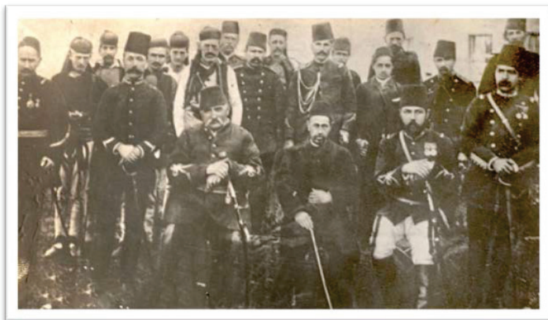
Prilog 1. Osnivači Prizrenske lige.

formiranju sopstvenih snaga za sprječavanje zauzimanja albanskih teritorija 77 čiji je sastavni dio bio i Kosovski vilajet. Komiteti Lige su se u nekoliko navrata obraćali i učesnicima kongresa u Berlinu i sultanu Abdul Hamidu II, kako bi oni uticali na dobijanje autonomije za Albance. 78