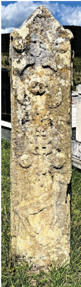
Prilog 6. Nišan iz Glisnice na prednjoj strani posjeduje pri dnu antropomorfnu figuru jelena iznad koje je stilizovani topuz a zatim niz polu jabuka i krugova sa ukrasnim elementima. Svi ovi ornamenti su sastavljeni, a na čelu nišana je i jedan krst.