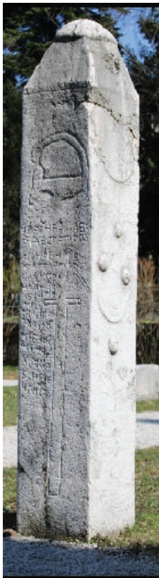
Prilog 4. Nišan Mahmuta Brankovića u vrtu Zemaljskog muzeja u Sarajevu.