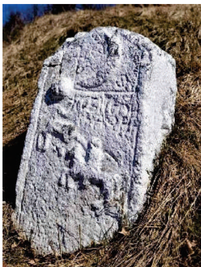
Prilog 2. Nišan iz Govedovića kod Trnova sa natpisom i prikazom na lov i polujabukom i polumjesecem (Fotografija Nihada Klinčevića).