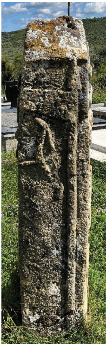
Prilog 6b. Sa lijeve strane luk sa strijelom i koplje.