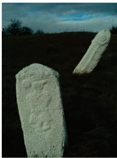
Prilog 3. Ljudski lik, zmija i polujabuka, mač na nišanima iz Turova kod Trnova.