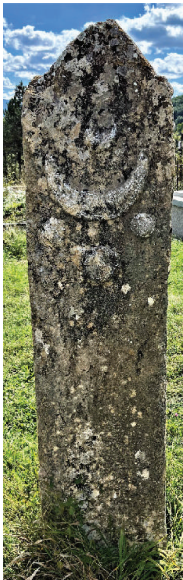
Prilog 6c. Na zadnjoj strani polu jabuke i polumjesec.