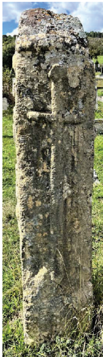
Prilog 6a. Sa desne strane postoji uklesani mač.